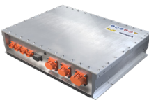
Vehicle Interface Box (VIB)